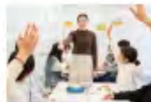
次世代教育学部 教育経営学科