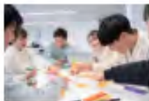
経済経営学部 現代経営学科