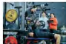
体育学部 体育学科