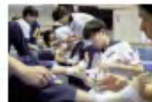
体育学部 健康科学科