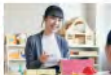
次世代教育学部 こども発達学科