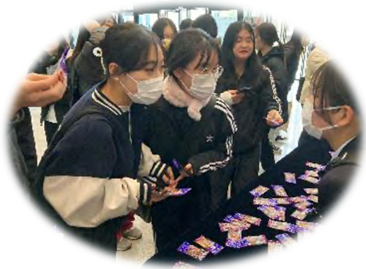
佐賀県立唐津青翔高等学校生徒と釜山外国語大学校学生との交流場面 (青翔高校生が企業と共同開発したピリ辛のアジの干物の食品「よかAJI」を配布)