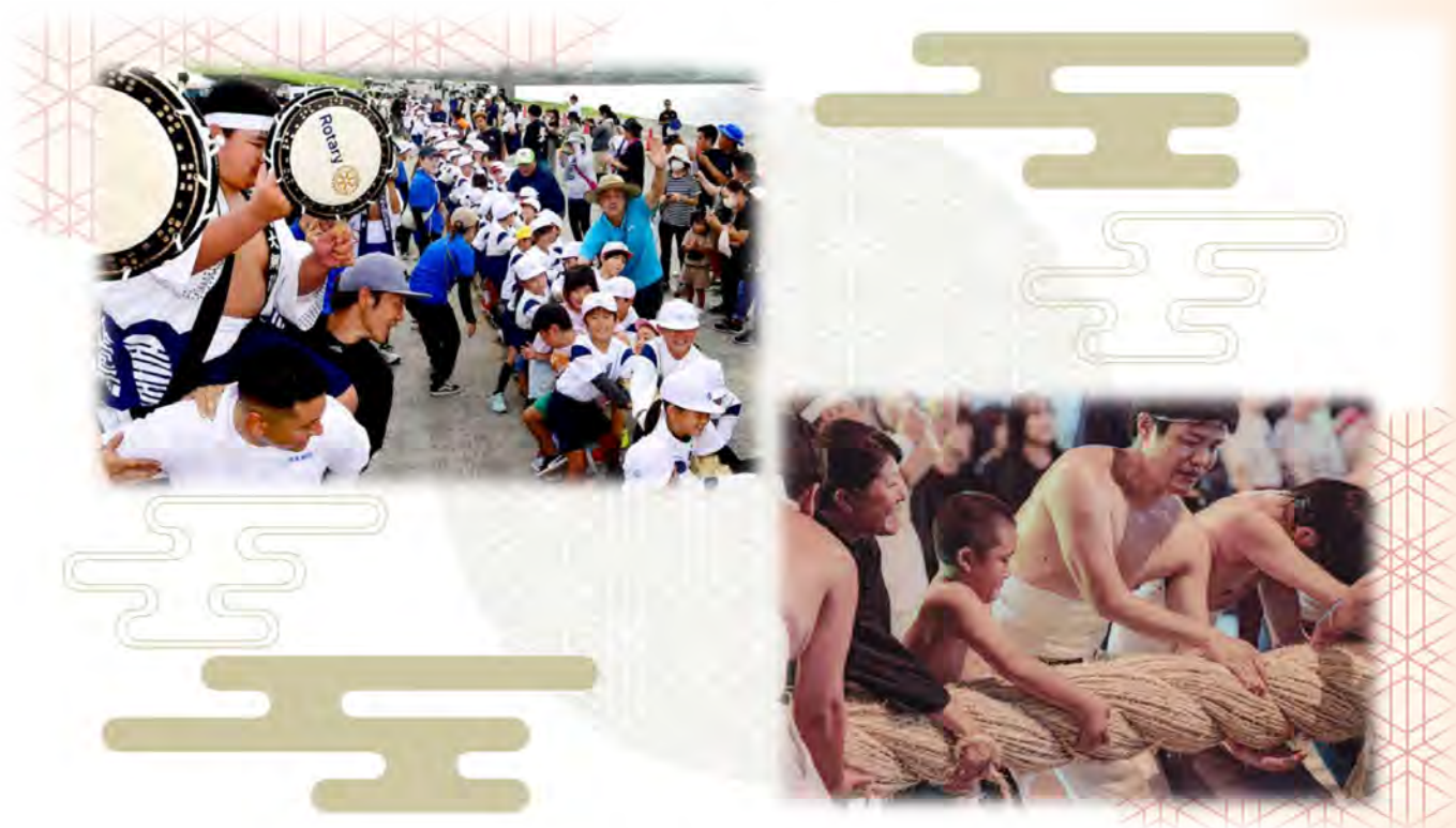
川内大綱引（鹿児島県薩摩川内市）