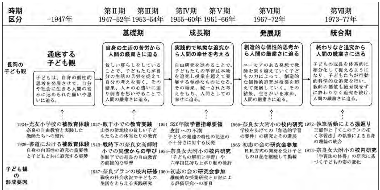
図 長岡の子ども観の形成過程(筆者作成)

この検討から長岡の子ども観は、通底する子ども観をベースに、基礎期(自身の生活の苦勞から人間の厳肅さに迫る)、成長期(実践的で執拗な追究から人間の幸せを考える)、発展期(創造的な個性的思考から人間の厳肅さに迫る)、統合期(終わらぬ追究により人間の厳肅さに迫る)の4段階で変容していったといえる。